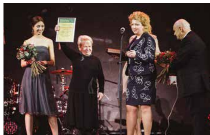
Главный редактор газеты «Культура» Елена Ямпольская вручила почетный диплом «Связь времен» всеми любимым Александре Пахмутовой и Николаю Добронравову