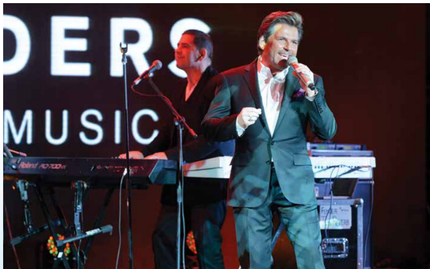
Томас Андерс (Thomas Anders)

По приглашению РАО для участия в вечере в Москву прилетели зарубежные звезды: Томас Андерс (Thomas Anders), Демис Руссос (Demis Roussos) и итальянская певица Ингрид (In-Grid).