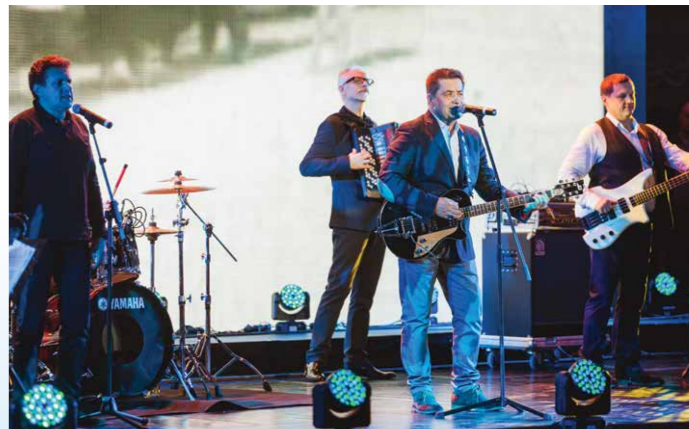
Российских правообладателей поддержали многие звезды, выступившие на концерте