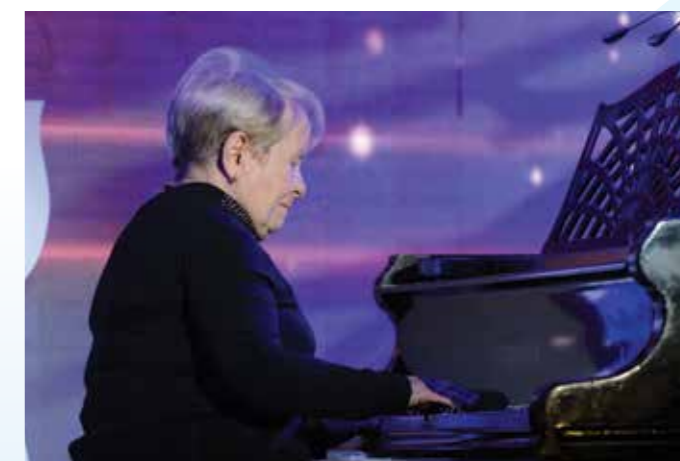
За роялем Александра Пахмутова