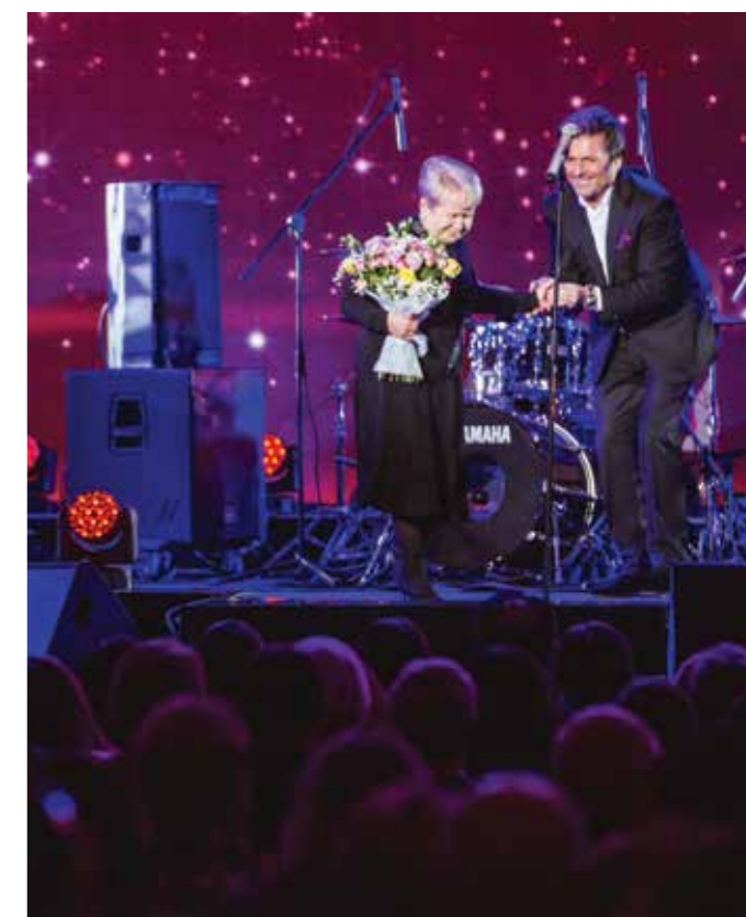
Томас Андерс и Александра Пахмутова

Кульминацией вечера стала песня «Нежность» в исполнении Томаса Андерса под аккомпанемент автора музыки Александры Пахмутовой.