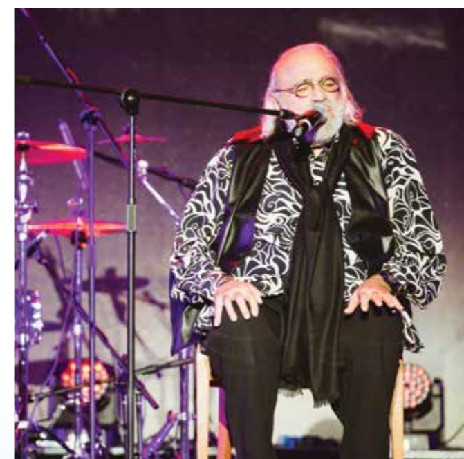
Демис Руссос (Demis Roussos)

На протяжении всего вечера ведущие Александр Адабашьян и Лиза Арзамасова знакомили зрителей с историей развития системы охраны интеллектуальной собственности в нашей стране и с живыми примерами создания культурной традиции сегодня. Расположенные на сцене экраны транслировали видеоряд, который оживал благодаря голосу Сергея Чонишвили и переносил зрителей в различные пери-